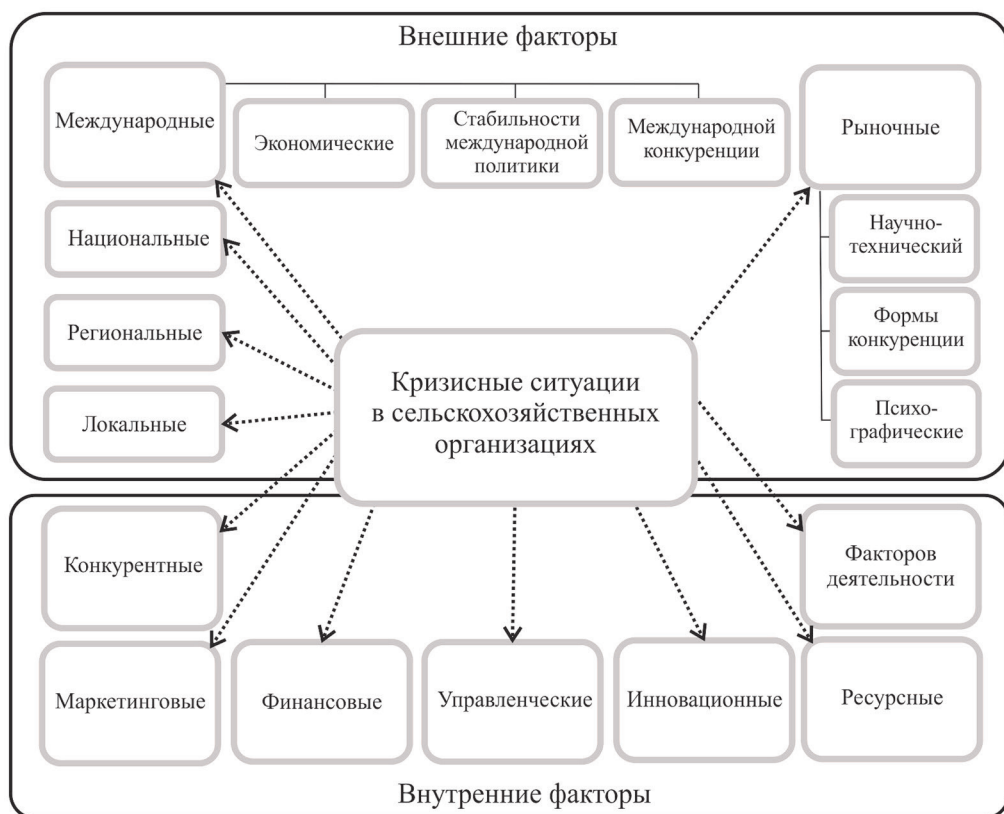
Рис. 1. Классификация кризисных ситуаций в сельскохозяйственной организации в зависимости от факторов их возникновения (выполнен автором по [3])

Кризисная ситуация часто приводит к негативным последствиям предприятия, выраженным в росте издержек производства и себестоимости, уменьшении выручки от реализации продукции, размера собственных оборотных средств, возникновении неплатежеспособности, увеличении заемных средств, кредиторской