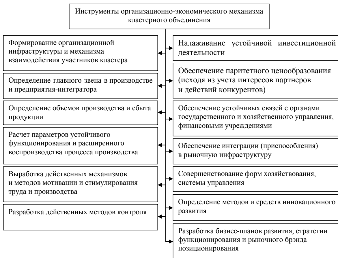
Рис. 2. Базовые инструменты функционирования организационно-экономического механизма кластера в АПК (выполнен автором по материалам собственных исследований)

Таким образом, установлено, что организационно-экономический механизм кластера представляет собой совокупность равновесий на различных уровнях и в разных структурах – отдельных,