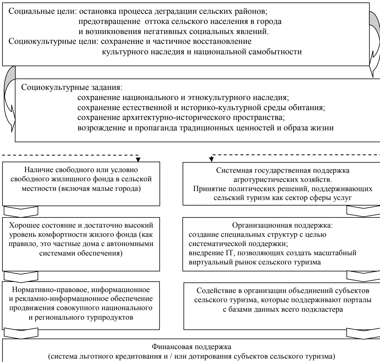
Рис. 2. Цели, задачи и направления европейской модели развития сельского туризма

Государственная политика развития сельского туризма в странах Евросоюза основана, главным образом, на социальных и социокультурных целях, включая прекращение деградации сельских территорий и оттока с них населения, минимизации негативных социальных явлений, сохранении и частичном восстановлении культурного наследия и национальной самобытности. Непосредственно в европейских странах концептуальные подходы предусматривают использование ресурсов домашних хозяйств как средств размещения и туристических возможностей местных сообществ в целом (сельских, поселковых и близлежащих малых городов). Важным фактором развития туризма является высокий уровень комфортности жилого фонда сельских регионов. Таким образом, концепция базируется на принципах продвижения малого семейного гостиничного бизнеса сельских территорий [2].