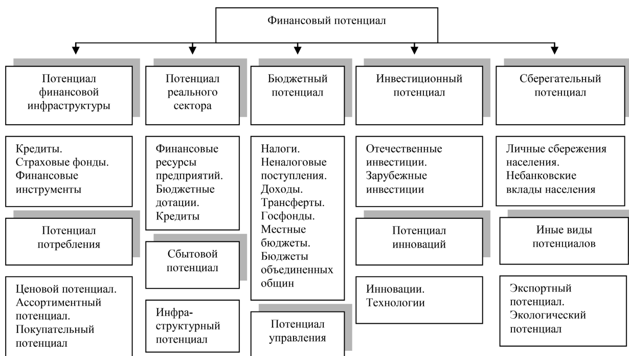
Рис. 1. Методологические основы формирования структуры финансового потенциала сельского развития Украины (составлен авторами на основании источников [15, 16])

Принимая во внимание сложившуюся практику оценки финансового потенциала, направленные на ее совершенствование предложения ряда исследователей, а также ранее описанные нами подходы к оценке состава финансовой аграрной инфраструктуры, можно заключить, что важнейшими составляющими последней являются ресурсы: