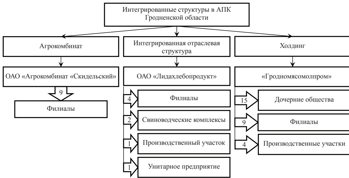
Рис. 1. Интегрированные структуры в АПК Гродненской области