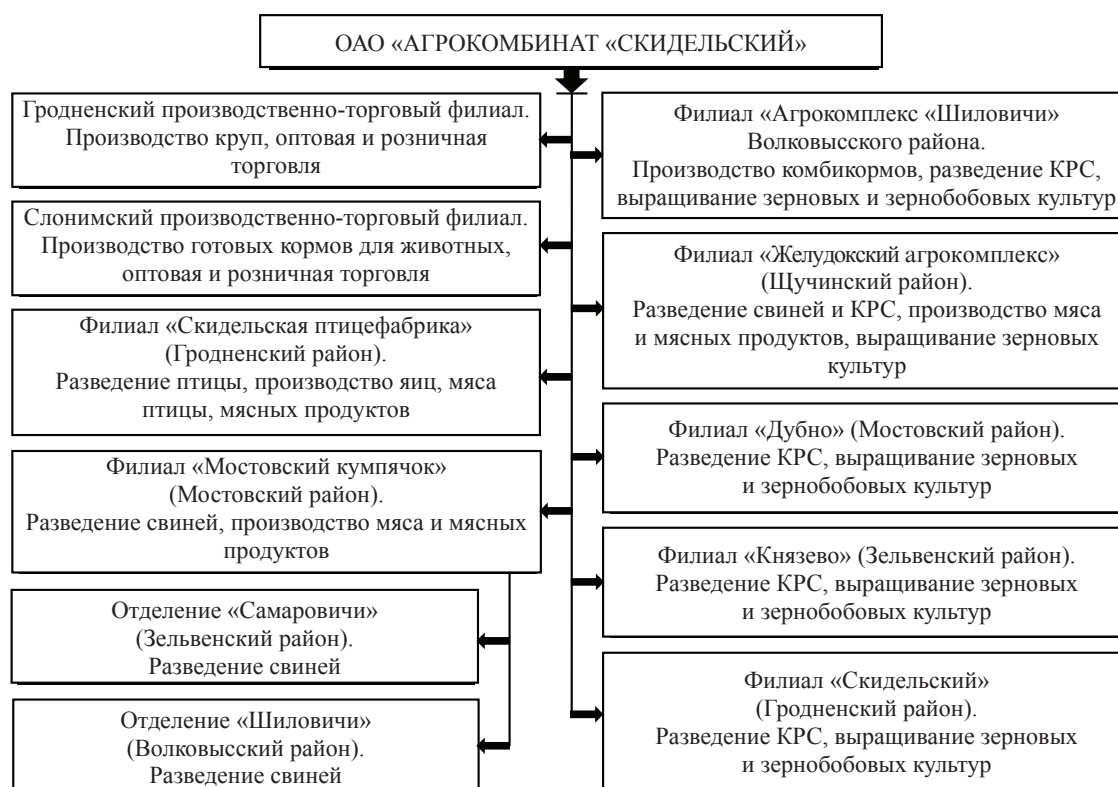
Рис. 3. Организационная структура ОАО «Агрокомбинат «Скидельский»

Рассмотрим результаты работы холдинга «Гродномясомолпром». За 2016 г. входящими в его состав подразделениями, перерабатывающими молоко и мясо, были переработаны (произведены) следующие товары: