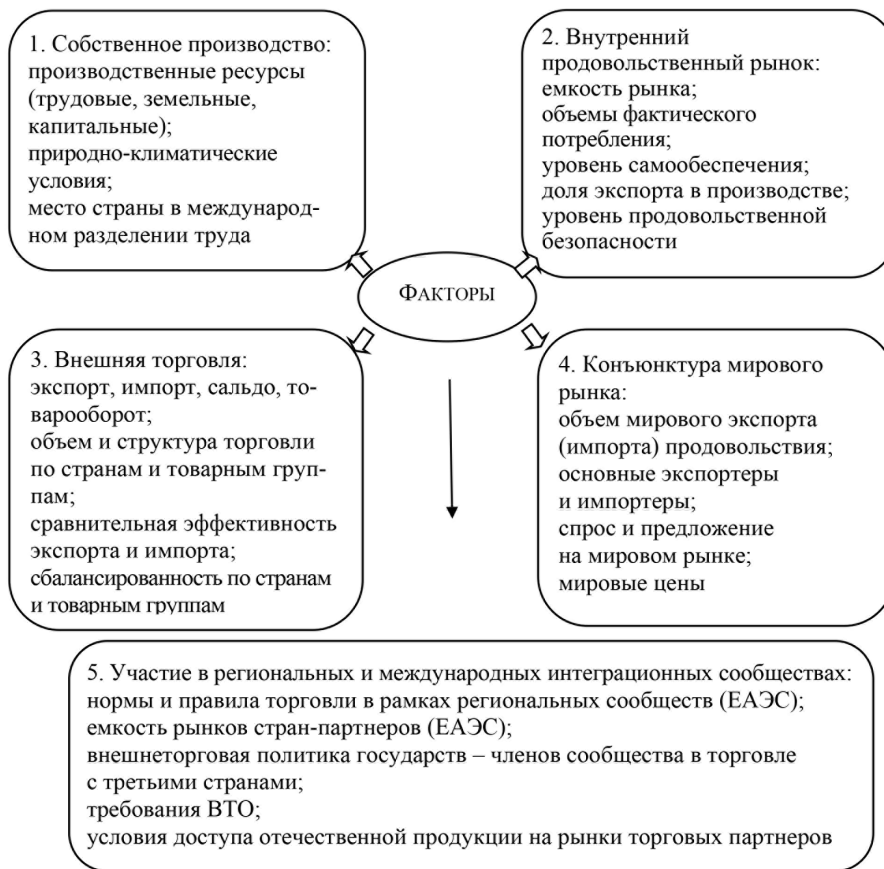
Рис. 1. Система факторов, обуславливающих сбалансированность внешней торговли Беларуси агропродовольственными товарами (выполнен автором на основании источников [3, 4, 5, 6].)

Учитывая это, нами разработаны методические подходы, включающие определение целей и трактовку понятия «сбалансированность взаимной торговли», методику оценки и алгоритм формирования сбалансированного развития взаимной торговли агропродовольственными товарами Беларуси с государствами – членами ЕАЭС.