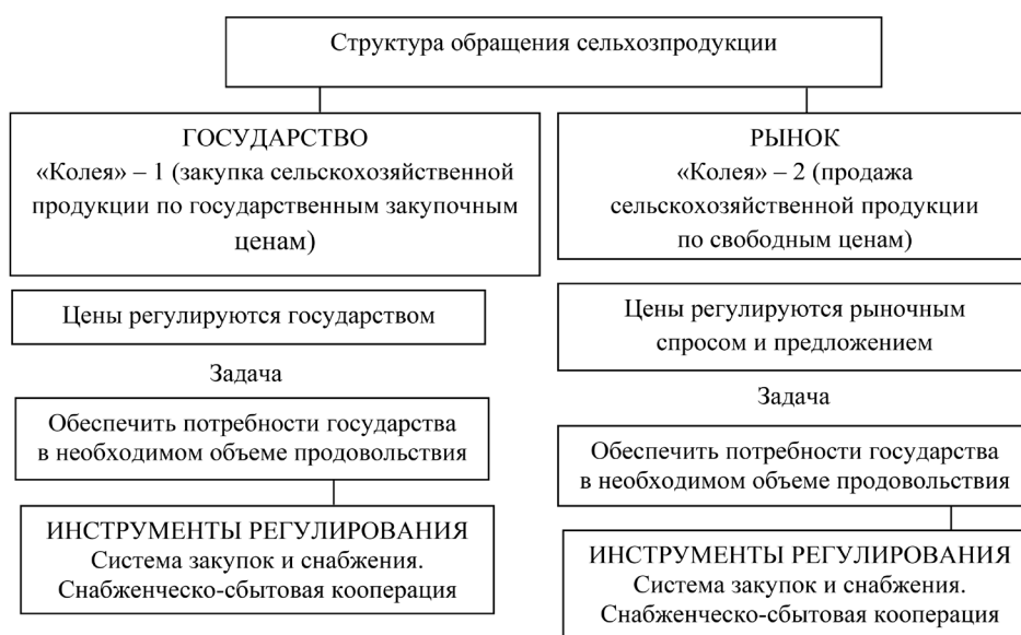
Рис. 3. Сущность двухколейной системы управления производством и обращением сельхозпродукции (собственная разработка)

Главным итогом реформы сельского хозяйства Китая явилось формирование в сельской местности «нового экономического пространства» семейных хозяйств и поселково-волостных пред-