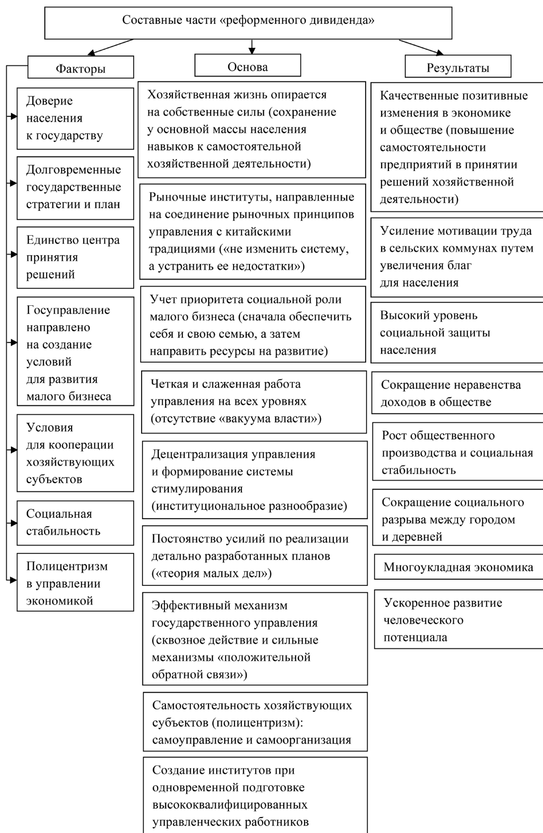
Рис. 1. Факторы, основа и результаты «реформенного дивиденда» в Китае (собственная разработка)